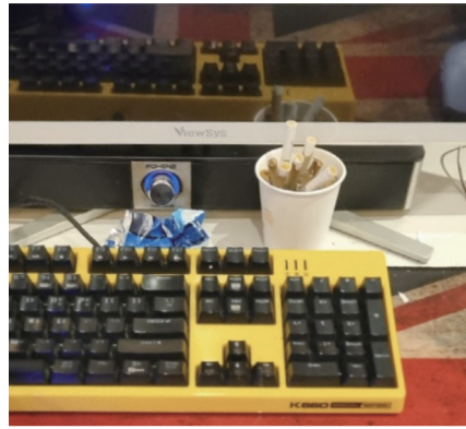
최근 광주 남구 노대동의 한 PC방 좌석에 놓인 종이컵 안에 담배꽂이가 수북히 쌓여있다.

건강증진법 개정안 시행 13년째 담배연기에 비흡연자 고통 '심화' 처벌규정 미비·인력부족 등 원인 "업무교육 강화·단속 확대 할 것"