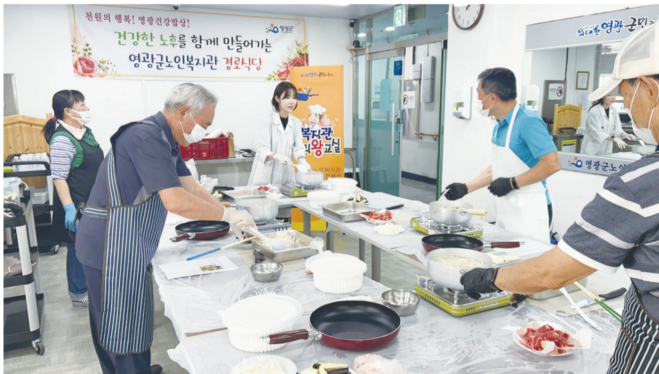
영광군노인복지관 관계자가 어르신들에게 요리법을 지도하고 있다. 지난 3월부터 영광노인복지관에서는 남성 어르신들을 대상으로 매월 '어르신요리교실'을 운영하고 있다.

버스무료이용은 (유)영광교통농어촌 버스가 운행하는 노선만 가능하며 인근 지자체(고창군, 장성군, 함평군 등)에서 허가를 받고 운행하는 버스는 탑승 시 요금을 내야한다. 영광-김도윤 기자