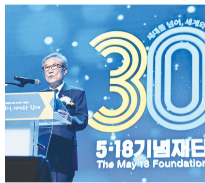
정신 헌법 전문 수록을 비롯해 5·18기념사업 기본법 제정, 5·18진상규명특별법 개정에도 힘을 쏟을 것을 다짐했다.

재단은 출범 당시 내건 △5·18 진상규명 △책임자 처벌 △피해자들의 명예회복 △배상과 보상 △기념사업으로 대표되는 '5·18 문제 해결 5원칙' 해결 방침을 되새겼다. 또 정치권에서 공전하고 있는 5·18