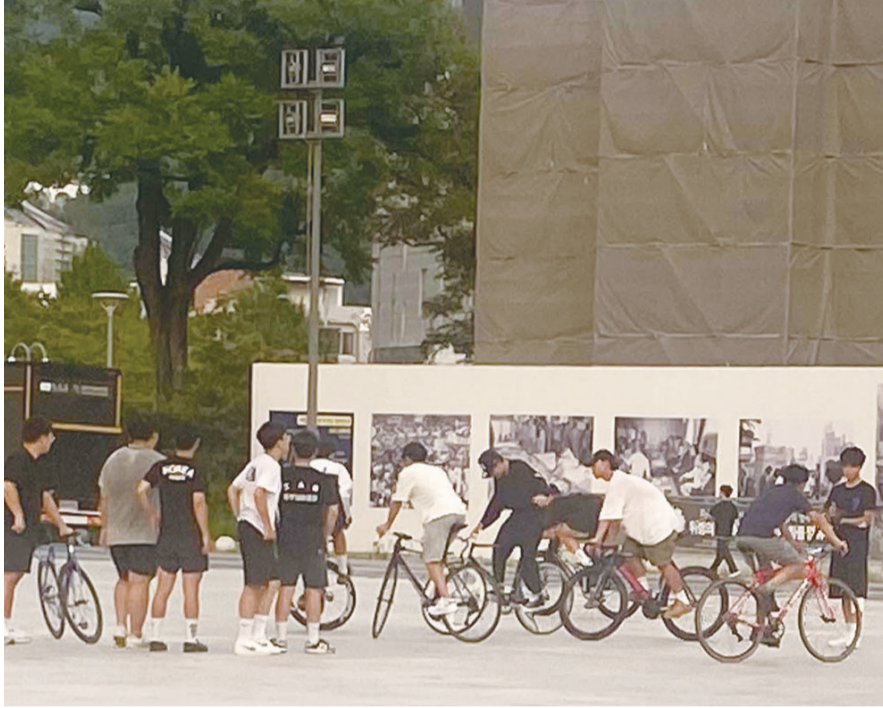
최근 광주 동구 국립아시아문화전당 5·18 민주광장에서 청소년들이 '픽시 자전거'를 타고 묘기를 부리고 있다.

전씨는 "처음에는 친구들과 자전거를 타고 싶다는 아들의 부탁에 해당 자전거를 사주려고 했다"며 "구매를 위해 인터넷에 검색했더니 제동장치가 없어 위험하다는 글이 많았다. 아들 말을 들어보면 친구들과 어울리기 위해서 자전거가 필요하다고 하는데 흑어디칠까 걱정된다"고 털