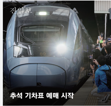
추석 기차표 예매 시작

진일보는 전남일보가 제공하는 온라인 뉴스서비스입니다. 많은 의견과 제보를 바랍니다.