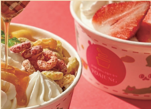
요아정 제품 모습.

두바이 초콜릿도 편의점을 중심으로 인기를 끌고 있다. 두바이 초콜릿은 아랍에미리트의 한 유명 인플루언서가 SNS(사회관계망서비스)에 영상을 올린 뒤 알려지기 시작했다. 두바이 초콜릿은 아직 국내에 정식 출시되지 않았다. 그럼에도 유통업계에서는 유사한 제품들을 만들며 유행에 편승하고 있다. 국내 편의점 4사 모두 두바이 초콜릿을 출시해 판매 중이다. 백화점 3사도 두바이 초콜릿 팝업 매장을 열었다. 두바이 초콜릿을 직접 만들어 파는 카페도 늘고 있다.