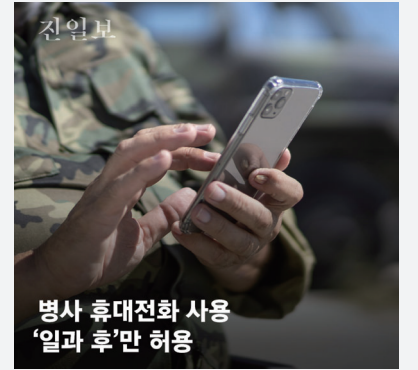
병사 휴대전화 사용 '일과 후'만 허용

추석이 한 달여 앞으로 다가온 가운데 추석 연휴 기차표 예매가 시작됐다. 온라인과 전화(고객센터)로 예매할 수 있으며, 역 창구에서는 예매하지 않는다. 결제 기간을 놓쳐 취소된 승차권은 예약 대기자에게 배정된다. 코레일(KTX, ITX-새마을, 무궁화호) 예매일은 오는 21~22일(교통약자 8월19~20일), SRT 예매일은 오는 28~29일(교통약자 26~27일)이다.