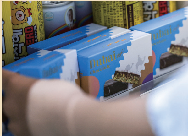
7일 서울시내 CU 편의점에 두바이 초콜릿이 진열돼 있다.