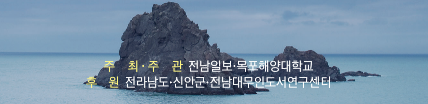
주최·주관 전남일보·목포해양대학교 후원 전라남도·신안군·전남대무인도서연구소