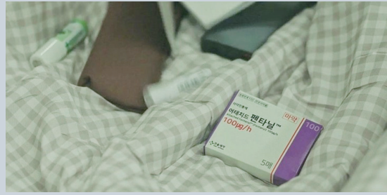
웨이브 자체 제작 드라마 ‘악한 영웅’에 등장한 마약 펜타닐.

최근 배우 유아인 등 유명인들의 마약 투약 사실이 드러나면서 마약 범죄에 대한 관심이 높아지고 있다. 이에 온라인 환경에 익숙한 청소년들이 마약에 손을 대는 사례까지 늘고 있다. 지난 7일 서울 동대문경찰서는 인터넷으로 구입한 마약을 투약한 혐의로 A(14)양을 전날 불구속 입건했다고 밝혔다. 중학교 3학년인 A양은 인터넷 메신저인 텔레그램으로 필로폰 0.05g을 구매해 6일 오후 6시40분쯤 동대문구 전농동 집에서 투약한 혐의(마약류관리법 위반)를 받는다.