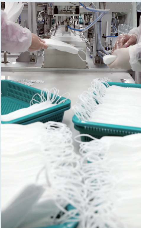
#SnackNews #마스크폐손상 #김혜인기자 #최홍은편집디자인

지난달 30일 실내마스크 착용 의무가 해제된 가운데 코로나19 바이러스는 물론, 미세먼지로부터 호흡기를 보호하는 마스크가 되려 폐를 망칠 수 있다는 소식에 마스크를 벗을지 말지 시민들의 고민은 깊어지고 있다. 바이러스뿐만 아니라 미세먼지 때문이라도 마스크를 쓸 상황에 남아있기에 마스크에 대한 연구는 앞으로도 꾸준히 진행될 것으로 보인다.