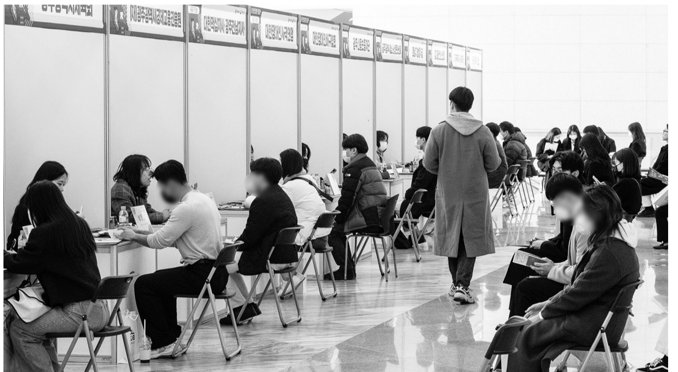
제13기 드림만남의 날 개최

한편, 국민의힘 제3차 전당대회 본경선 투표는 오는 3월4일부터 7일까지 모바일, ARS(자동응답) 투표로 진행된다. 모바일 투표는 3월 4~5일, ARS 투표는 모바일 투표 미참여자에 한해 3월 6~7일 이틀간 진행된다. 김해나 기자