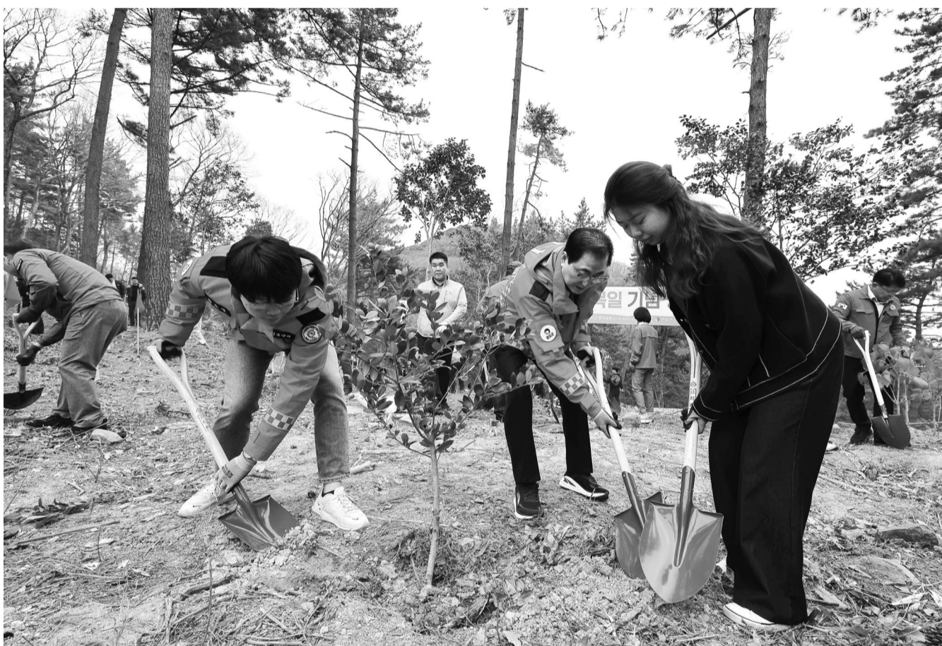
지난 3일 완도군청 직원들이 제80회 식목일을 맞아 군외면 삼두리 일원에서 호랑가시나무를 심고 있다.