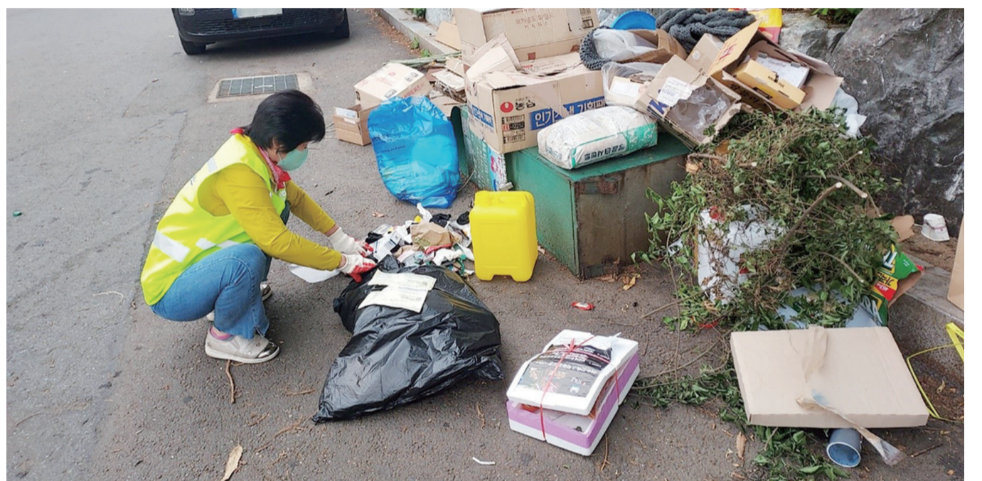
불법투기 감시원이 종량제 봉투를 사용하지 않고 배출한 쓰레기를 단속하고 있다.