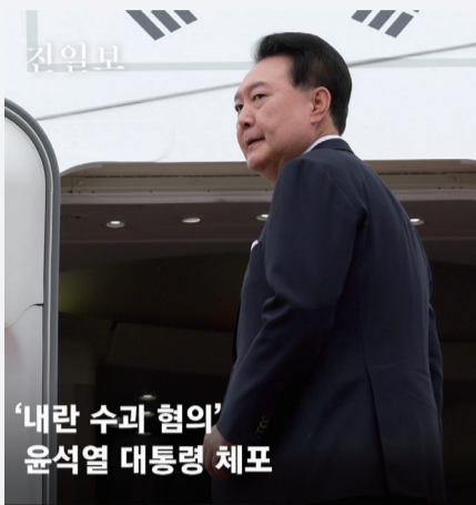
'내란 수괴 혐의' 윤석열 대통령 체포

헌정사상 처음으로 현직 대통령이 체포됐다. 고위공직자범죄수사처와 경찰이 15일 오전 4시 관저에서 체포영장 집행을 시도한 지 6시간여만이다. 윤석열 대통령은 이날 영상 메시지를 통해