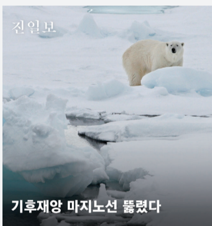
기후재앙 마지막 선 돌파

지난해 지구 평균기온이 기후재앙을 막는 마지막 선이라고 불리는 '1.5도'를 넘어섰다. 유럽연합의 기후변화 감시기구인 '코페르니쿠스기후변화서비스'에 따르면 지난해 지구평균기온이