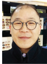
문화예술 기획자/ 철학박사·미학전공

한국에서는 잊어버리는 것에 대해 '새까맣다'라는 표현을 쓴다. 오늘날 우리나라의 부고는 검은색 선으로 테두리 친 것이 관례다.