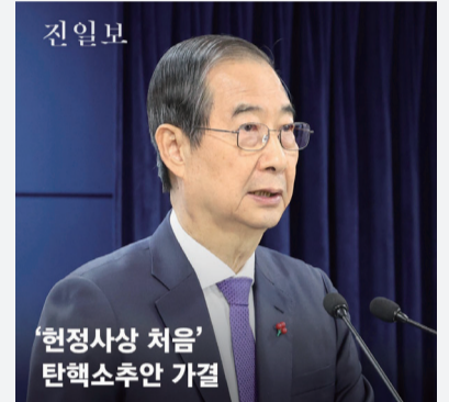
‘헌정사상 처음’ 탄핵소추안 가결

헌법재판소가 지난 27일 윤석열 대통령 탄핵심판 1차 변론기일을 열었다. 쟁점 정리를 주도할 수명재판관인 이민선-정형식 재판관이 심리를 진행했다. 정재판관은 윤 대통령 측에 “탄핵심판 청구의 적법 요건을 다들 생각이 있느냐”고 물었고, 윤 대통령 대리인 배보윤 변호사는 “있다”고 답했다. 윤 대통령 측은 현재의 송달 과정이 적법하지 않았다고 주장했으며 ‘12·3 비상계엄’과 관련해 계엄이 선포됐고 포고령이 발표됐다는 정도의 표면적 사실관계는 인정하되, 계엄 선포 경과나 국무회의 회의록 및 포고령 발표와 관련한 구체적인 내용은 “설명할 내용이 있다”며 추후 정리에 밝히겠다고 했다.