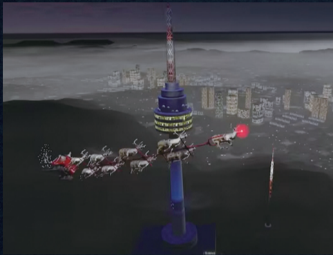
지난 24일 북미항공우주방위사령부는 산타와 루돌프가 한국에 방문했다고 밝혔다. 사진은 남산타워를 지나는 산타의 모습.