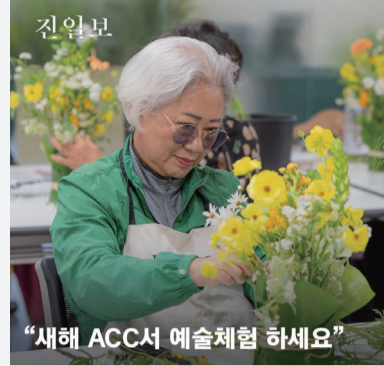
“새해 ACC서 예술체험 하세요”

진일보는 전남일보가 제공하는 온라인 뉴스서비스입니다. 많은 의견과 제보를 바랍니다.