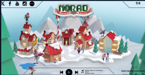
미항공우주방위사령부는 매년 산타 추적 서비스를 진행한다. 사진은 올해 처음 개시한 한국어판 사이트.