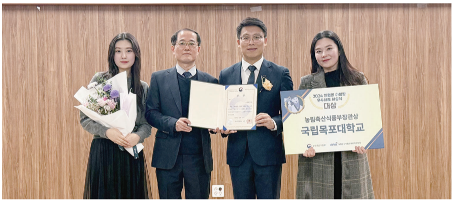
국립목포대 관계자들이 지난 12일 세종시 농정원 1층 대강당에서 열린 농림축산식품부 주관 2024년 천원의 아침밥 우수사례 성과보고회에서 대상을 수상한 뒤 기념촬영하고 있다.

지난해 최우수상에 이어 연속 수상 전국 참여학교 190개교 중 1위 차지 프리미엄 조식 뷔페 레스토랑 운영 학생 참여 증가 및 만족도 제고