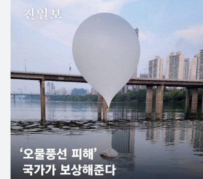
‘오물풍선 피해’ 국가가 보상해준다

정부가 ‘스텐드메(스튜디오 촬영·드레스·메이크업) 가격 표시제 등이 담긴 결혼서비스 지원방안을 발표. 짝꿍이로 운영돼 신혼부부를 눈물짓게 했던 스텐드메 가격을 의무 공개한다. 신혼부부는 결혼을 위한 서비스 비용으로 평균 2310만원의 값을 제공해 왔다. 정부는 서비스별 가격이 공개되는 것만으로 소비자들의 예측 가능성이 높아진다고 봤다. 정부는 사업 신고 없이 운영되는 결혼준비대행사 사업 신고 의무화 후 품목별 세부 가격을 공개하는 가격 표시제를 도입하고 내년 상반기 중 결혼 관련 품목·서비스 가격을 제공할 예정이다.