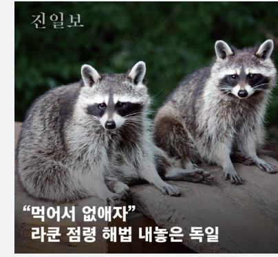
“먹어서 없애자” 라쿤 접령 해법 내놓은 독일

진일보는 전남일보가 제공하는 온라인 뉴스서비스입니다. 많은 의견과 제보를 바랍니다.