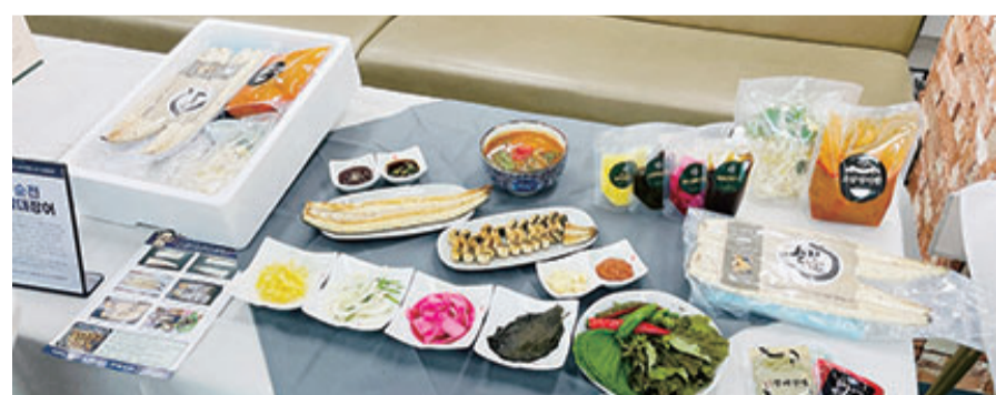
순천시는 지난 8일 순천로컬푸드 신대점에서 순천 대표 간편식(밀키트) 제작·마케팅 위탁교육 성과평가회를 성공적으로 개최했다.