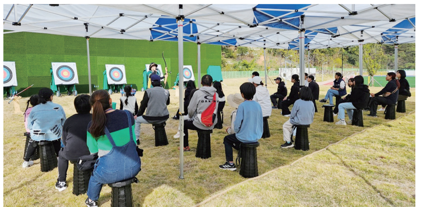
지난 9일 순천 유·청소년들이 뉴 스포츠 캠프에 참가해 양궁 체험을 하고 있다.