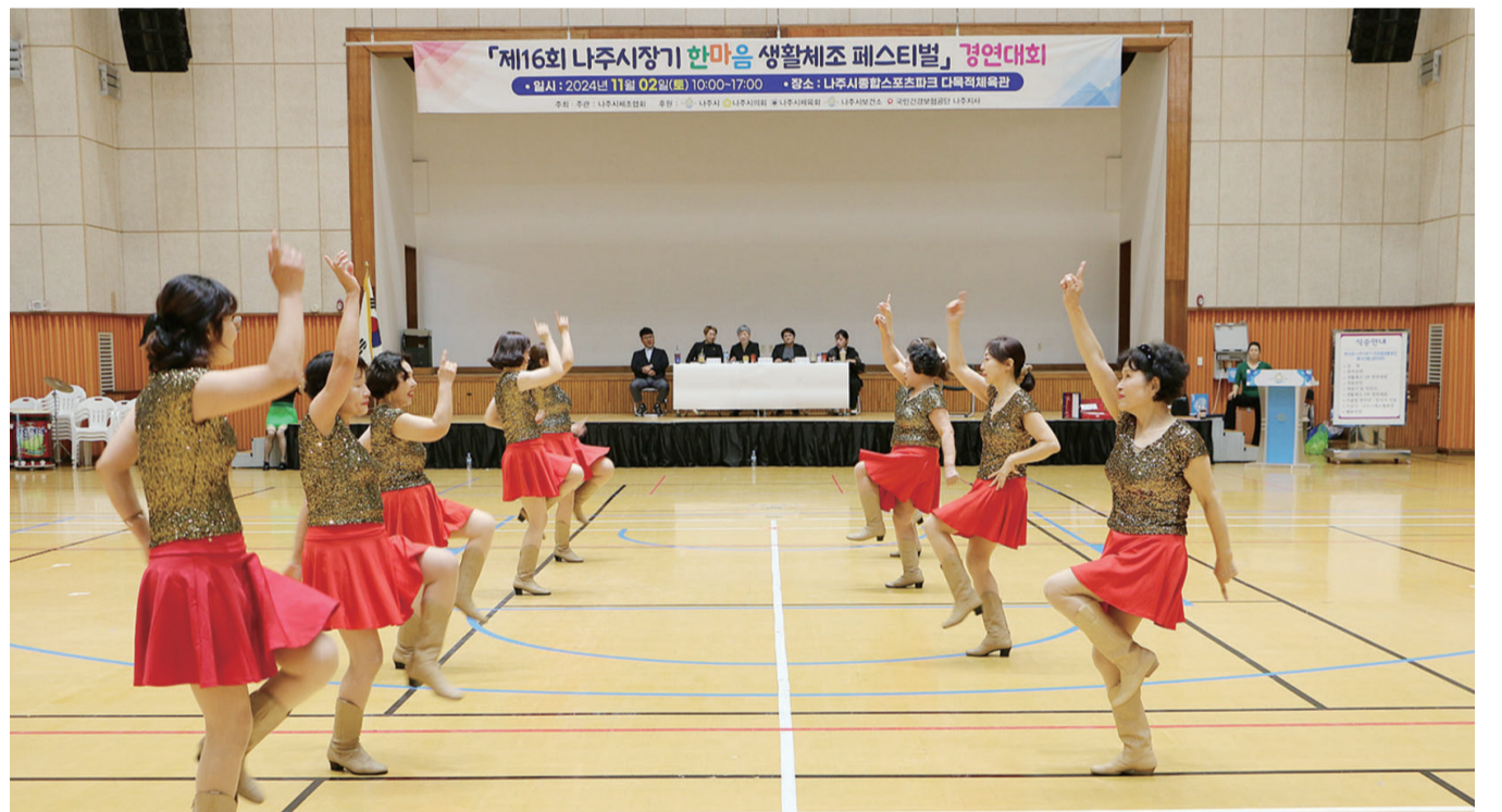
제16회 나주시장기 한마음 생활체조 페스티벌에 평생학습 동아리 회원들이 생활체조를 하고 있다.