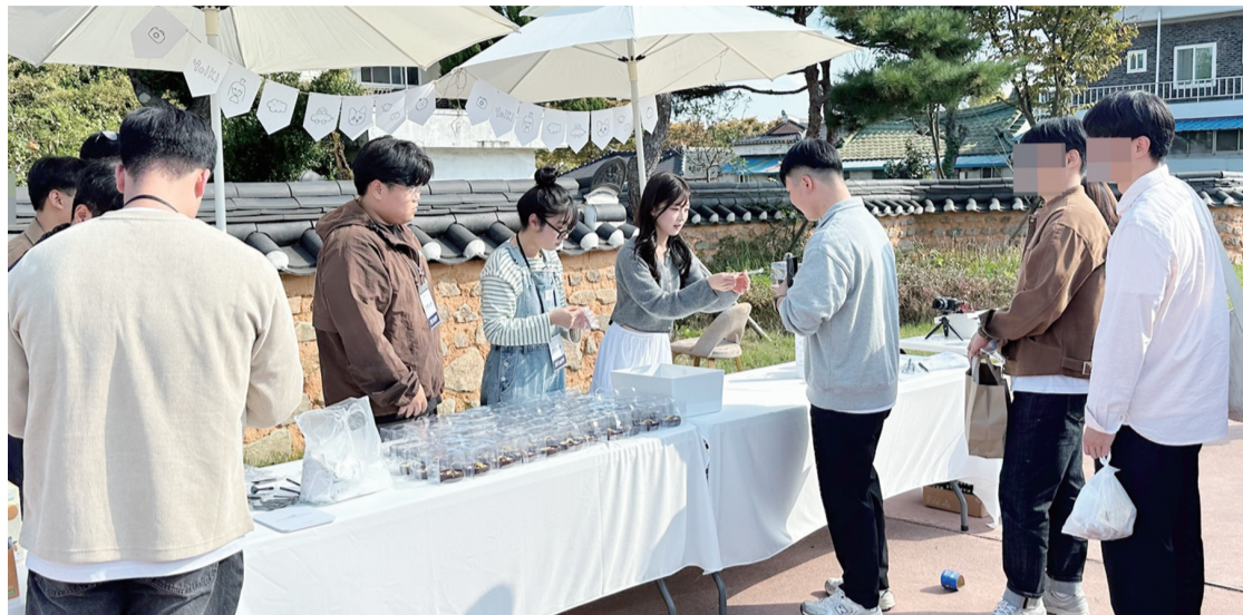
나주시가 지난 7일 동헌공원 일원에서 구독자 71만명을 보유한 유튜버 채널 '가요이 키우기'와 협업으로 배 디저트 2종을 시민들에게 배부했다.

시는 가요이 키우기 채널에 나주 홍보영상 2편을 제작·업로드해 관광지과 특산물, 먹거리 등을 소개한