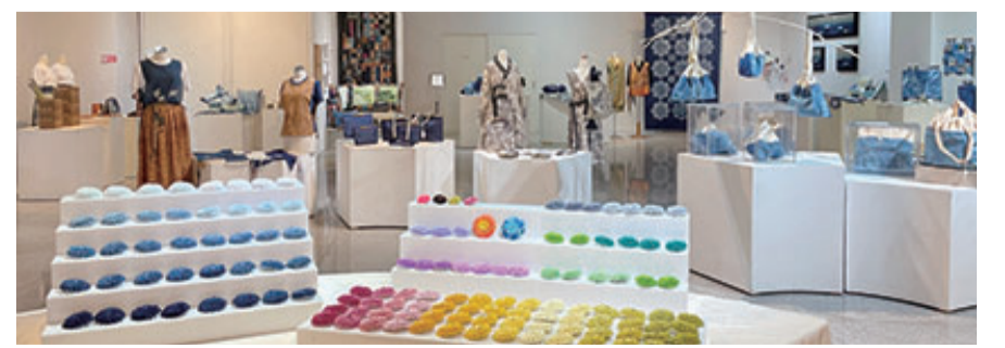
나주시가 제19회 천연염색문화상품대전 수상작을 12월8일 까지 전시한다.