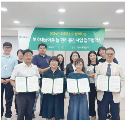
그랜밍을 지원하고 있다. 지난해부터 전남 지역 8개 파트너기관을 발굴하고 현재까지 1억1800만원의 자원을 연계하고 있다.

초록우산 전남지역본부는 '모든 어린이가 성장과 행복을 추구할 권리'인 아동 발달권 주체로 지역에 기반한 아동권리프로