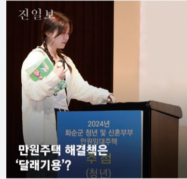
만원주택 해결책은 '달래기용'?

화재 발생 시 불길이 번지는 것을 막기 위해 내려오는 방화셔터에는 사람이 나갈 수 있는 '비상문'이 있다. 하지만 '길이 막혔다'고 생각해 다른 탈출구를 찾다가 화를 입는 경우가 많다. 참변을 막기 위해 방화셔터 비상문 사용법을 숙지하는 것이 좋다. 일체형 방화셔터는 비상구와 합쳐져 있기 때문에 비상구 문을 손이나 몸으로 밀면 된다. 분리형 방화셔터는 3m 이내 설치된 별도의 비상구 문을 찾아 대피해야 한다. 스크린형 방화셔터는 두 겹으로 이뤄진 천막 형태의 스크린이 내려오면 첫 번째 천막을 걷고, 두 번째 천막을 밀어 대피한다.