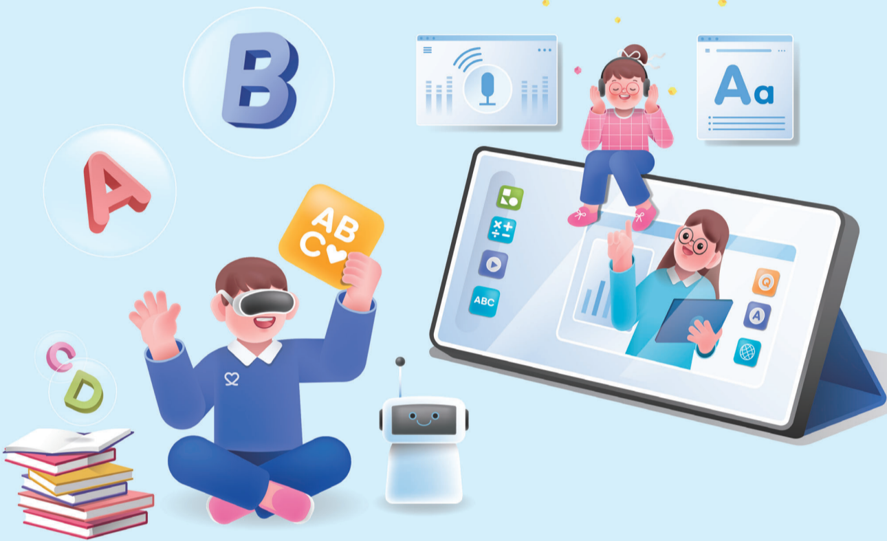
#SnackNews #디지털교과서 #강주비기자 #박지은편집디자인

교육부의 AI 디지털 교과서 도입을 두고 찬반 논쟁이 팽팽하게 이어지고 있다. 교육부는 내년 3월부터 초·중·고 수학, 영어, 정보 및 특수 국어 과목에 AI 교과서를 우선 도입하고, 2028년까지 국어, 수학, 영어, 사회, 과학 등으로 확대할 계획이다. 그런데 최근 국회 국민동의청원에 올라온 '디지털 교과서 도입 유보 청원'이 교육위원회에 회부됐다. 청원에는 많은 전문가들이 스마트 기기의 부작용을 지적해 왔고, 학교에서도 스마트 기기 사용을 강요하는 것이 부적절하다는 주장이 담겼다. 반면 교육부는 디지털 교과서가 학생 개인별 맞춤형 교육을 가능하게 해 교육의 질을 높일 것이라는 입장이다. 디지털 교과서는 단순한 디지털 기기가 아니라, 학생들이 스스로 질문하고 토론하며 문제를 해결하는 '개념 기반 탐구수업'을 지원하는 도구로 사용될 것이라는 주장이다. 또, 디지털 기기를 안전하게 사용하는 방법을 가르치는 디지털 시민 교육을 강화해 부작용을 최소화할 계획이다. 해외에서는 종이 교과서를 다시 도입하거나 디지털 기기 사용을 금지하는 국가도 있지만, 폴란드와 싱가포르처럼 초등학생들에게 노트북을 지급하는 프로그램을 운영하는 국가도 있다. 일본은 생성형 AI를 교육에 활용하는 가이드라인을 발표했다.