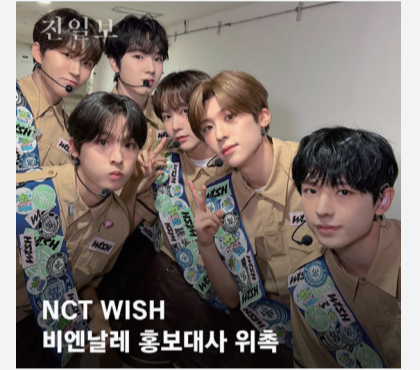
NCT WISH 비엔날레 홍보대사 위촉

화순 만원주택 당첨자 A씨는 입주 지연으로 오갈 곳이 없어졌지만, 당첨된 아파트의 입지, 층수 등을 고려해 다른 곳으로 입주가 불합리하다고 판단, 긴급 입주 신청을 포기했다. 이에 화순군은 '당첨 아파트에 짐만 놓고 리모델링 후 입주'라는 방안을 제안했지만, 본보 취재 결과 "이삿짐이 있는 경우 리모델링 공사 진행이 어렵다. 짐만 옮기는 방안은 위약금 등 때문에 A씨에게만 말씀드린 것이다"며 말을 바꿨다. A씨가 안내받은 대안은 애초에 존재하지 않았던 것. A씨는 결국 새로 집을 구해야 하며 7월 중 이사를 위해 계약했던 이삿짐센터에도 위약금을 물어줘야 한다.