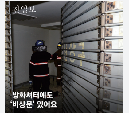
방화셔터에도 '비상문' 있어요

올 하반기부터 예약장 용도로 개방된 공공시설이 기존 120여개에서 168곳으로 48곳 늘어난다. 국립미술관과 박물관 등 개성 있는 결혼식을 올릴 수 있는 곳은 △국립중앙박물관(아외) △국립민속박물관(아외) △국립현대미술관(아외) △국립중앙도서관(실내) △중앙교육연수원(실내) 등이다. 광주·전남의 개방 공공시설은 △다도해해상국립공원 안내소(아외) △무등산생태탐방원(아외) △주말 작은 결혼식장(실내) △영암 누리파크 웨딩정원(아외) △순천 낙안읍성 객사(아외) 등이 있다. 예약은 공유누리 홈페이지에서 가능하다.