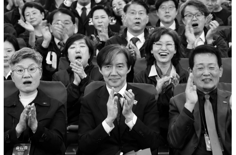
조국신당 '환호' 조국 조국혁신당 대표 등이 10일 여의도 국회에서 개표상황실 출구조사 발표를 시청하며 박수하고 있다.