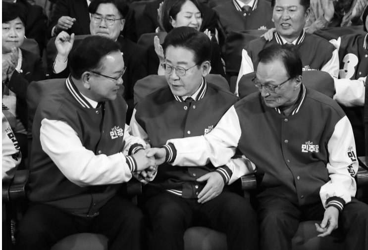
출구조사 압승 '축하' 이재명·이해찬·김부겸 민주당 상임공동선거대책위원장이 10일 국회 의원회관 총선 개표 상황실에서 방송사 출구조사 결과를 지켜본 후 악수를 나누고 있다.